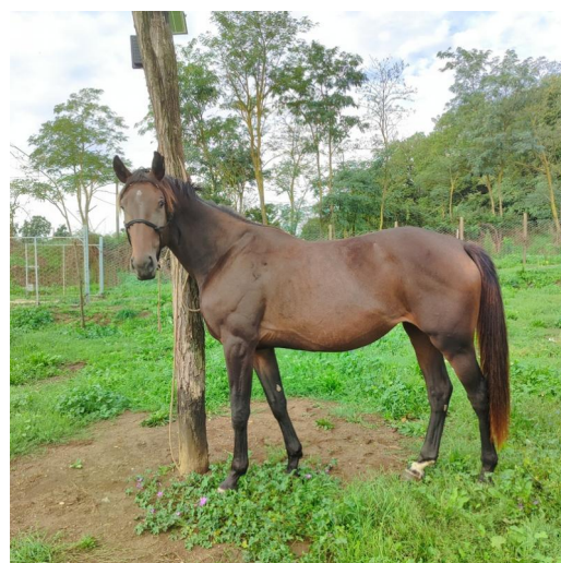
M.ORVIETANA DELLE MORELLE