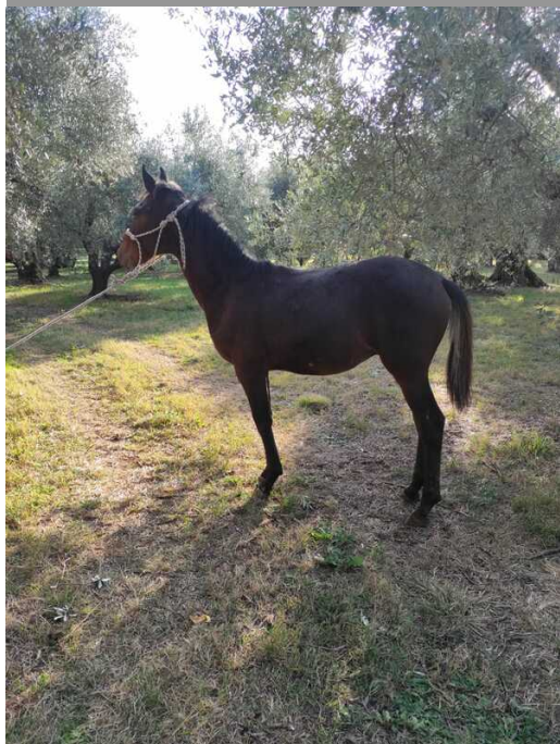
M.RESPIRO DI VALLEBONA