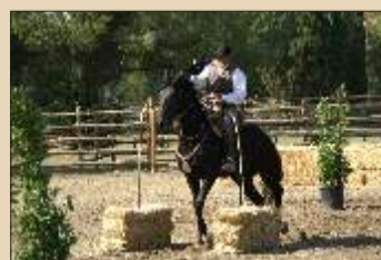
Gara di abilità

Ogni tappa prevede, in base alle possibilità della sede ospitante, tre tipi di prove: